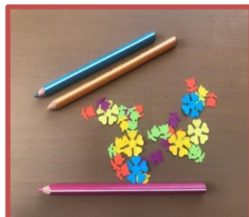
Matériel de décoration prêt