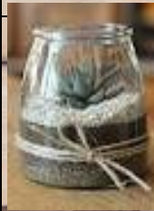
Déco pot de fleurs (pass 1)