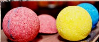
Boules de bain