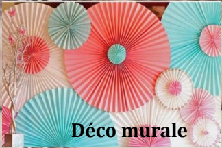
Déco murale en origami